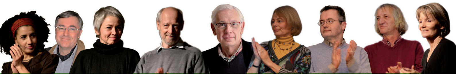
A. CHABROLLE Ain

http://rhone-alpes.regions-europe-ecologie.fr