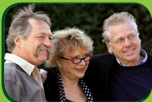
José Bové, Eva Joly, Dany Cohn-Bendit

Le 14 mars, votons pour une région capable de sauver notre agriculture, notre alimentation et nos emplois.