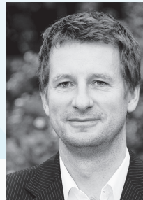
YANNICK JADOT DÉPUTÉ EUROPÉEN

Ancienne juge d'instruction, spécialiste des dossiers politico-financiers, elle s'illustre notamment dans l'affaire Elf. Conseillère de gouvernements, elle est depuis 2009 députée européenne la circonscription Ile de France.