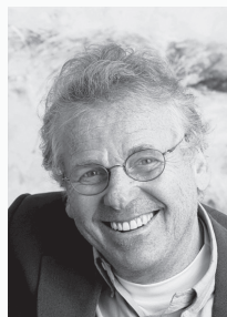
DANIEL COHN-BENDIT CO-PRÉSIDENT DU GROUPE VERT AU PARLEMENT EUROPÉEN

Urbaniste, élue à Villeneuve St-Georges (94), elle est élue secrétaire nationale du parti écologiste Les verts en 2008, en portant le projet du Rassemblement Europe Ecologie.