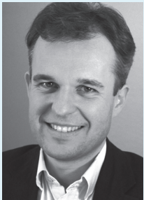
FRANCOIS DE RUGY PRÉSIDENT DU COMITÉ DE SOUTIEN

Infirmière en psychiatrie et arthérapeute. Conseillère régionale sortante, adjointe à Thorigny, en charge de l'agenda 21 local, militante associative. Membre de la commission solidarité solidarités humaines et territoriales, elle a travaillé à la mise en place des conditionnalités des aides dans les contrats territoriaux uniques et la création des maisons de santé.