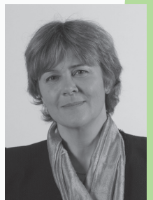
DOMINIQUE VOYNET MEMBRE FONDATRICE DU PARTI DES VERTS

C'est lors de son 3ème mandat de député européen qu'il réunit les principales composantes du mouvement écologiste en France dans le Rassemblement Europe Ecologie. En 2009, pour les élections européennes, il conduit la liste Europe Ecologie en Ile de France.