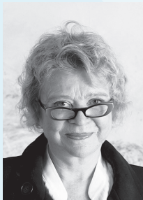
EVA JOLY DÉPUTÉE EUROPÉENNE

Député écologiste de Loire-Atlantique, conseiller municipal d'Orvault et Conseiller communautaire de Nantes Métropole.