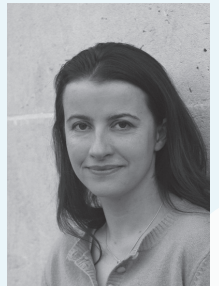
CÉCILE DUFLLOT TÊTE DE LISTE EUROPE ECOLOGIE ILE DE FRANCE

Député européen de la circonscription Ouest de la France depuis 2009. En 2008, il quitte Greenpeace pour rejoindre Europe Ecologie car face à la crise écologique, il considère que l'offre politique est insatisfaisante voire indigente : "A nous d'incarner cet espace qui représente largement plus de 10 % dans l'opinion"