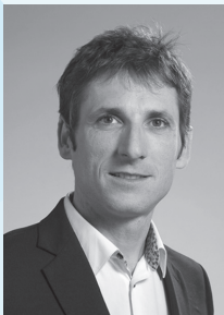
MATTHIEU ORPHELIN TÊTE DE LISTE EUROPE ECOLOGIE MAINE ET LOIRE