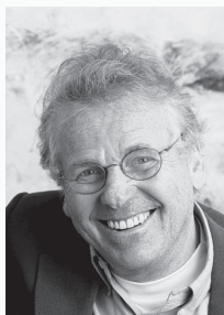
DANIEL COHN-BENDIT CO-PRÉSIDENT DU GROUPE VERT AU PARLEMENT EUROPÉEN

Urbaniste, élue à Villeneuve St-Georges (94), elle est réélue secrétaire nationale du parti écologiste Les verts en 2008, en portant le projet du Rassemblement Europe Ecologie.