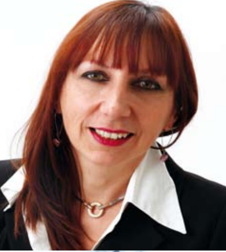
Anne Vignot Tête de liste du Doubs