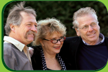
José Bové, Eva Joly, Dany Cohn-Bendit

L'écologie maintenant, c'est Europe Écologie dans votre région!