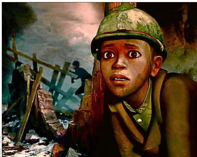
C'est en partant à la recherche de son frère qu'Adama découvre l'horreur.

Pour donner un aspect particulièrement vivant à l'ensemble, le réalisateur a eu recours à des statues en terre cuite modélisées. « On voulait éviter un aspect trop lisse et trop soigné », explique Simon Rouby. Il fallait que le film ne ressemble à aucun autre. » Il gagne le pari haut la main