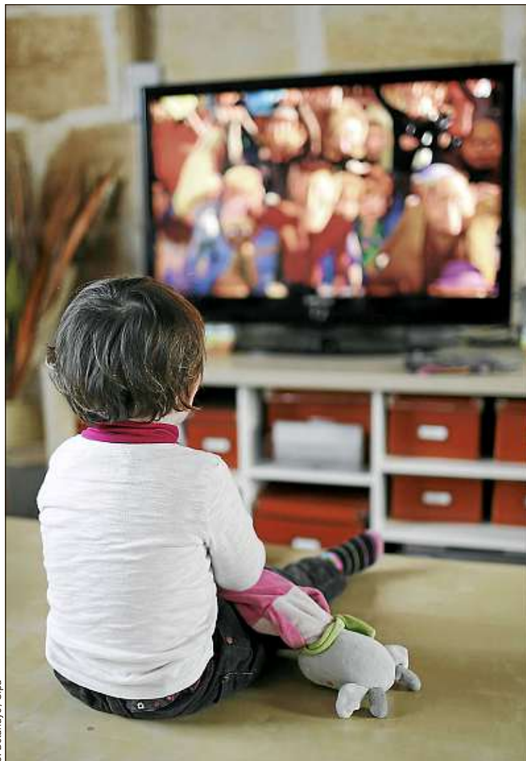
Les Français sont favorables à la fin de la pub lors des programmes jeunesse.

Plusieurs bémols cependant, car si la publicité adressée aux enfants disparaissait de la télévision publique, ces derniers y seraient exposés sur les chaînes privées, ce qui réduit la portée du texte. Pour que sa proposition de loi ait un impact sur le privé, le sénateur suggère que le Conseil supérieur de l'audiovisuel (CSA) remette chaque