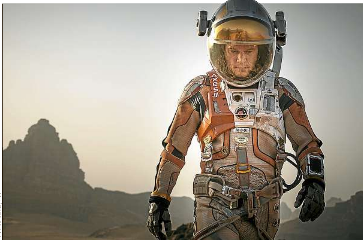
Matt Damon incarne un astronaute abandonné par les siens sur la planète rouge.

Ce recours à la GoPro par le réalisateur d' Alien (1979) et de Prometheus (2012) n'est pas une surprise, lui qui se passionne tout autant pour la science-fiction que pour les nouvelles techniques. « Il est important de rester ouvert aux innovations quand on fait