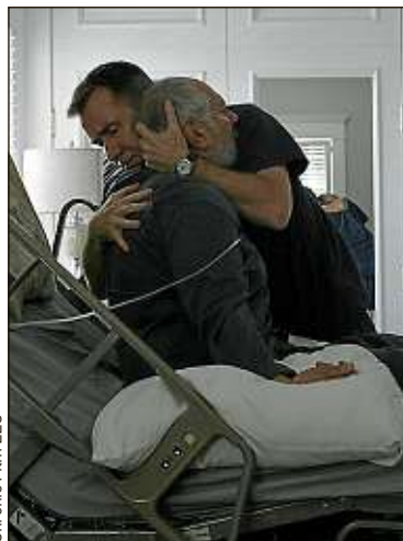
Tim Roth en infirmier compatissant.