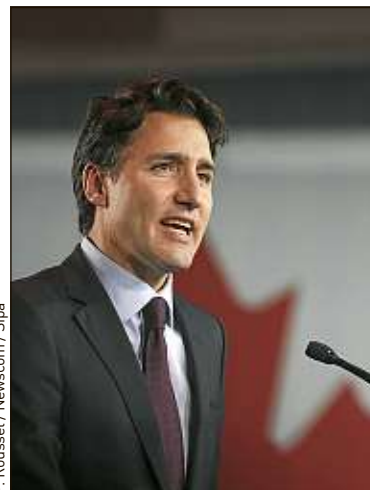
Justin Trudeau a balayé tous ses adversaires sur son chemin.