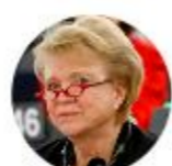
Eva Joly, Députée européenne, Candidate à l'élection présidentielle de 2012