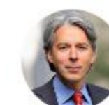
Jacques Boutault Maire écologiste du 2e arrondissement

Toutes nos propositions pour vivre mieux à Paris sur NAJDovski2014.FR