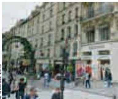
Le quartier Montorgueil s'est mobilisé.