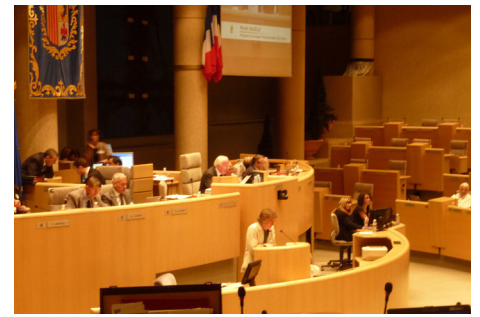
Intervention sur le contrat Etat/Région de Philippe Chesneau, co-président du Groupe EE/les Verts/Poc, lors de l'Assemblée Plénière du 28 juin 2010.

Ph. Chesneau est intervenu à la tribune sur la délibération Etat-Région. Le Groupe Europe Ecologie se positionne très clairement sur les critères permettant au Conseil Régional de geler les financements de la Région pour certains projets de