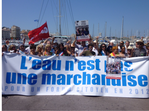
Manifestation « Porteurs d'Eau » (citoyen-n-es, syndicats, associations, collectifs, élu-e-s Europe Ecologie, les Verts, Poc, Front de Gauche, PS) sur le Vieux-Port à Marseille, 7 juillet 2010.