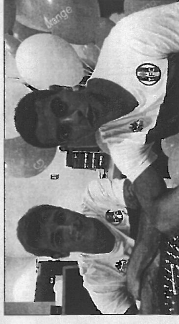
Qui est qui ?

publication Ligue 1*, rendez-vous sur : http://services-