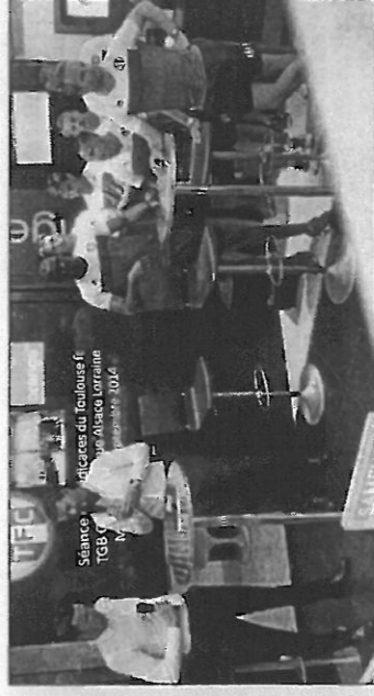
La séance de dédicace à la boutique Orange