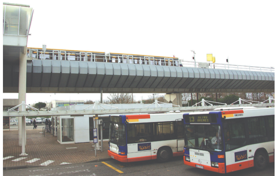
Lo depaus de busses a Bassa Comba.

Gérard Onesta, cap de lista d'Euròpa Ecologia per las regionalas en Miègjorn-Pirenèus, a declarat el qu'es un « marrít còp » e que i a la volontat de Pierre Cohen de « o tot contrarotlar ». Se diguèt