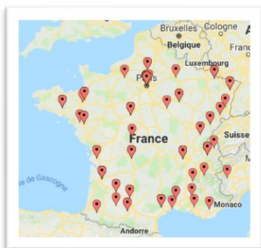
Les 100 premiers signataires

L'Appel est lancé par ces bénévoles et les 100 premiers signataires, hommes et femmes « anonymes », résidant partout en France, ayant des professions aussi diverses qu'artisan, coiffeur, responsables des ventes, agent immobilier, ouvrier, enseignant, infirmier, maraicher, photographe, instituteur, vétérinaire etc. Découvrez-les en ligne ici : www.nousvoulonsdescoquelicots.org/nos-soutiens