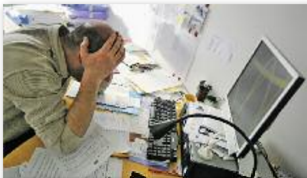
Le stress au travail qui s'installe dans la durée a toujours un coût pour la santé des individus.

« Si les causes de la souffrance au travail sont multiples (intensification, individualisation, emplois précaires, rémunération au résultat, sous-emploi...), ses conséquences sur la santé physique