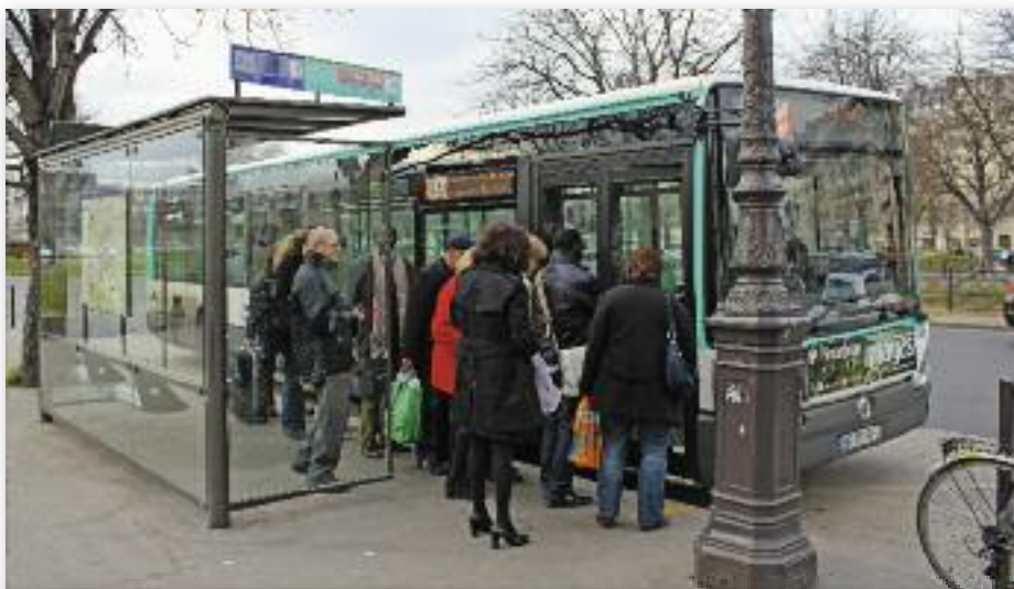
À la rencontre des électeurs et des électrices...

« Au contraire, j'ai bien aimé sa manière de tenir tête sur le nucléaire. Elle saura résister aux lobbies. Elle est courageuse, cette femme. » Visiblement, le parcours de l'ex-juge force l'admiration. Mais de là à convaincre les sceptiques, il y a un pas.