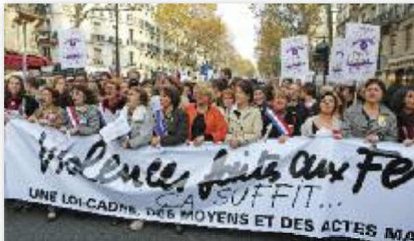
Aurevoir Mesdemoiselles, bonjour Mesdames et Messieurs...

Salaires bien plus faibles (de 27 % inférieurs à ceux des hommes), prédominance des emplois précaires (occupés à 80 % par des femmes), monopole des tâches ménagères, violences conjugales (une femme sur dix en est victime) : on est vraiment loin d'une égalité réelle entre femmes et hommes. Alors, à quand des changements en profondeur ? Candidate des écologistes, Eva Joly défend de son côté la création d'un ministère de l'Égalité