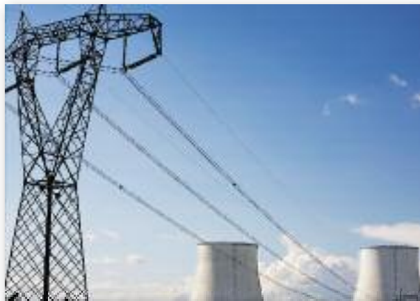
Eva Joly et les écologistes veulent sortir du nucléaire en 20 ans.

Aujourd'hui, seule la candidate des écologistes, Eva Joly, demande l'arrêt du chantier et la redirection des financements dans le développement des alternatives au nucléaire (éolien, solaire, biomasse, etc.). Nicolas Sarkozy et François Hollande veulent continuer l'aventure. Le premier souhaite même lancer un autre chantier. Mais on a du mal à imaginer ces champions de la ri-