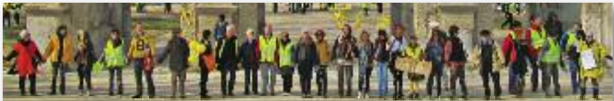
La chaîne humaine contre le nucléaire de Lyon à Avignon. 11 mars, une mobilisation historique.