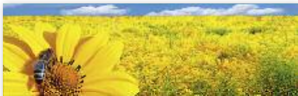
Les consommateurs ne veulent pas d'OGM dans le miel.

L a formule d'Einstein est bien connue : « Si l'abeille venait à disparaître, l'homme n'aurait plus que quelques années à vivre. » Une prophétie qui inquiète les apiculteurs du monde entier depuis une quinzaine d'années. Car les abeilles disparaissent, et le phénomène est si massif que