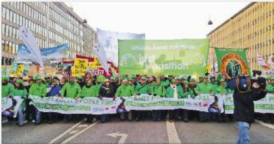
Depuis 2009 et le sommet de Copenhague, marqué par une mobilisation citoyenne exceptionnelle, les gouvernements ont abandonné le climat.