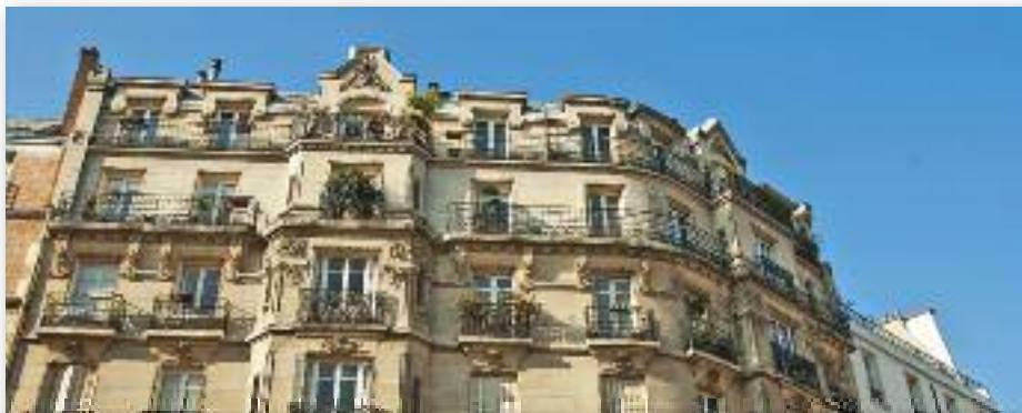
Eva Joly souhaite geler les loyers pendant trois ans et mettre en place un "miroir des loyers" pour les faire baisser.

13 mètres carré pour 700 euros ! Dans certaines grandes villes, il n'est pas rare de trouver de petits studios loués une fortune, en tout cas à un prix inaccessible pour une grande partie de la population. Pour les autres, un poids lourd qui grève le budget et contraint à de nombreux sacrifices, quand ce n'est pas au déménagement. En cause : une absence de régulation qui permet aux propriétaires, notamment lors des changements de locataires, d'augmenter sans limite leur loyer. Il est pourtant possible de déterminer le "juste prix" d'un logement. L'idée est simple : prendre comme