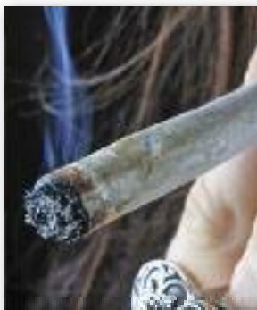
Légalisation contre trafic.

Dans le quartier des Beaudottes, à Sevran (Seine-Saint-Denis), où vivent dix mille personnes, dès 10h30, les dealers s'installent dans les entrées et les couloirs. Un habitant, depuis vingt ans dans le quartier,