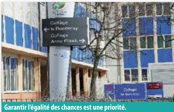
Garantir l'égalité des chances est une priorité.

« Mieux vaut donner confiance aux élèves en valorisant leurs points forts. Ça limite le risque qu'on se replie sur soi de peur d'être jugé et comparé. » Autre particularité du collège : les élèves ne sont pas séparés