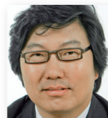
Jean- Vincent Placé