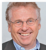
Dany Cohn- Bendit