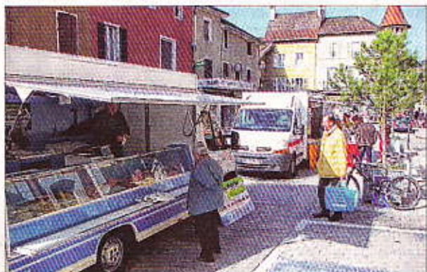
Même si la campagne est officiellement lancée depuis lundi, elle n'intéresse pas vraiment les électeurs de Yenne.

Sur le marché de Yenne, la campagne ne fait pas recette