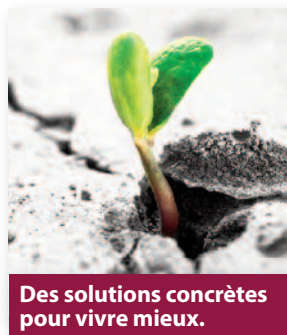
Des solutions concrètes pour vivre mieux.

Un-e élu-e Vert-e présent-e dans l'hémicycle d'un Conseil départemental renvoie aussi l'image d'une autre idée de la politique, transparente, vivante et utile, orientée vers l'intérêt général et respectueuse de la démocratie.