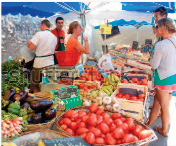
Les écologistes défendent une agriculture sans produits chimiques de synthèse ni OGM, un sol fertile et vivant !

Avec un peu de courage politique, le chemin du champ à l'assiette peut se faire plus court et plus joyeux.