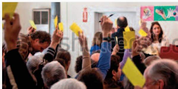
L'exercice du pouvoir fondé sur la participation des citoyens à la prise de décision est une vraie lutte.

• Avec le droit d'interpellation des citoyens, par exemple. Si une pétition est signée par 5 % d'habitants issus de plus de 10 % des communes du département, la demande sera abordée en séance publique du Conseil départemental.