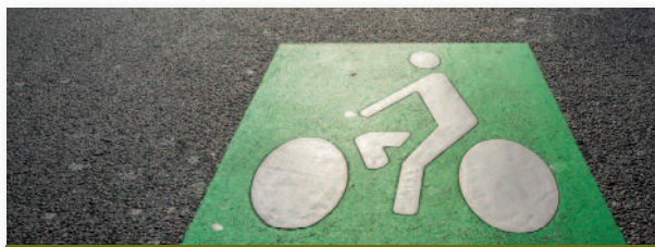
Les transports sont la deuxième source de consommation énergétique en France.

Se déplacer est une nécessité : aller travailler, faire ses courses, participer à la vie associative et culturelle, rendre... Se déplacer ensemble, c'est encore mieux : pour l'environnement, mais aussi