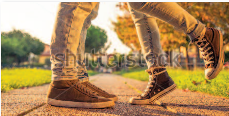
L'éducation à la citoyenneté, l'apprentissage du vivre-ensemble, de la médiation et de la non-violence font partie des missions du service public de l'éducation.

En privilégiant des établissements à taille humaine (400/500 élèves), en pesant pour une carte scolaire qui favorise la mixité sociale, les départements peuvent contribuer à transformer cette école qui concentre