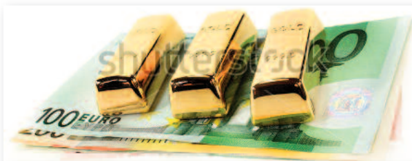
La fraude fiscale et le blanchiment de l'argent sont clairement connectés.

publique montrait ainsi l'exemple en exigeant la transparence de ses partenaires financiers? Exclusion des paradis fiscaux, lutte contre le blanchiment, investissements responsables... Chiche?