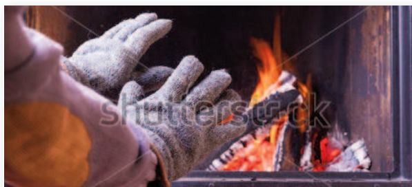
Une famille en situation de précarité énergétique se prive de chauffage ou s'endette fortement...

et les chauffages performants. Contre les "passoires énergétiques", des solutions concrètes: accompagnement des locataires, soutiens financiers en faveur de la rénovation thermique pour les propriétaires modestes (et sous condition de loyers modérés pour les bailleurs). Ce qui est bon pour la planète, l'est aussi pour le budget des plus fragiles.