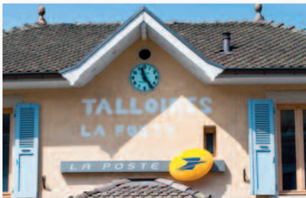
Le plan d'austérité sur les dépenses publiques menace gravement toutes les collectivités locales.

Ces inégalités fabriquent la frustration et le sentiment d'abandon d'une part non-négligeable de nos concitoyens - qui ne sont pas sans conséquences politiques - en favorisant le repli sur soi et la perte de confiance à l'égard de nos institutions. Privilégier la coopération, lutter contre la désertifica-