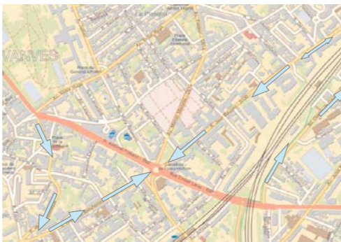
Proposition de sens unique dans les rues Jean Bleuzen et Raymond Marcheron pour limiter le trafic automobile dans le centre de Vanves

dans un Comité de projet. Les zones de rencontre (20 km/h maximum) auront été multipliées. En coordination avec les communes voisines, le trafic automobile s'écoulera sur une seule voie à sens unique sur les rues J. Bleuzen et R. Marcheron. L'espace dédié aux piétons et aux cyclistes aura été élargi d'autant. Nombre de livraisons seront effectuées à triporteur ou à vélo. Plutôt qu'une navette à itinéraire et horaire fixes, une offre de déplacements à la demande pour des trajets locaux - marché, stade, conservatoire, médiathèque... - aura été mis en place. Des collectifs de parents seront soutenus par la mairie pour des accompagnements groupés à pied des enfants vers les écoles.