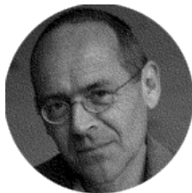
Bernard Stiegler, philosophe, co-fondateur d' ArsIndustrialis