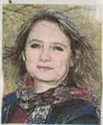
Corine Guignard, écologiste EELV.