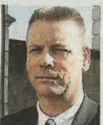
Jean-Luc Javel, Front national (FN).